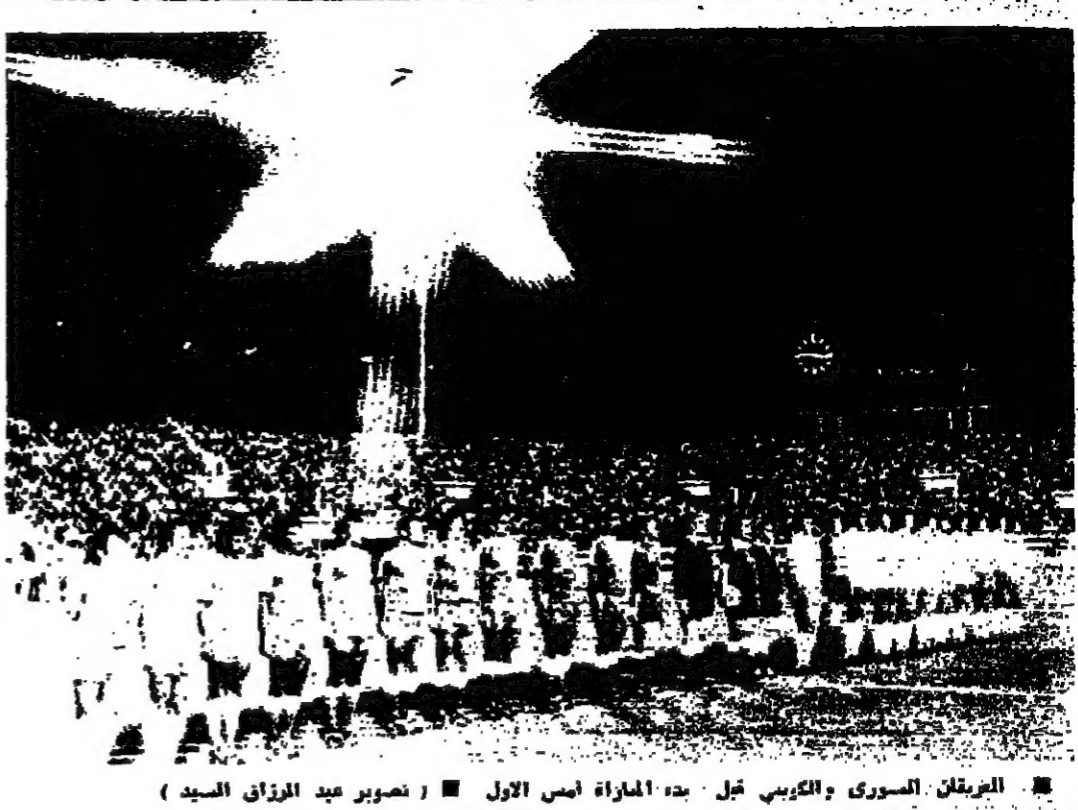
الوفد السوري والكوري في دمشق

الخطر امامنا أم وراعتا؟ كثر الذين يتخوفون من هجوم اميركي على الجنوب، هم الذين يتخوفون كما لو ان الهجوم مسبق، او كما لو انه خرافة في علم مضاعف. بل هم الذين يتخوفون كمثل البوم التي يتكلمها من اجل ان يصبح الهجوم اميركي حقيقة.